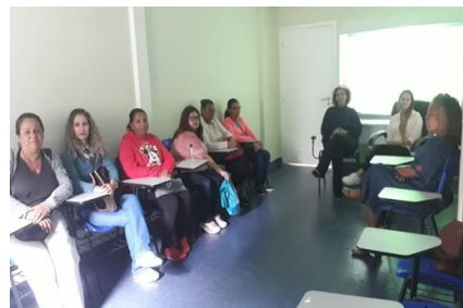
Grupo mensal de famílias