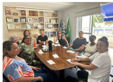
Voluntário: Grupo de psicanálise